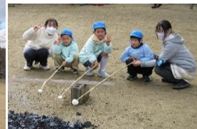
青組の子ども達は、自分でお餅を焼きました!